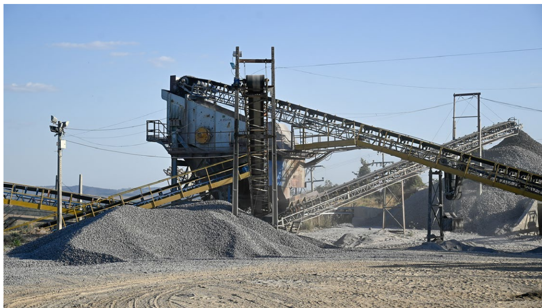
■ Operação da Britago, em Santa Bárbara de Goiás: automação e inovação tecnológica

Outro segmento incluído na agenda da Fieg foi o de mineração, representado pela Britago . A visita, realizada na