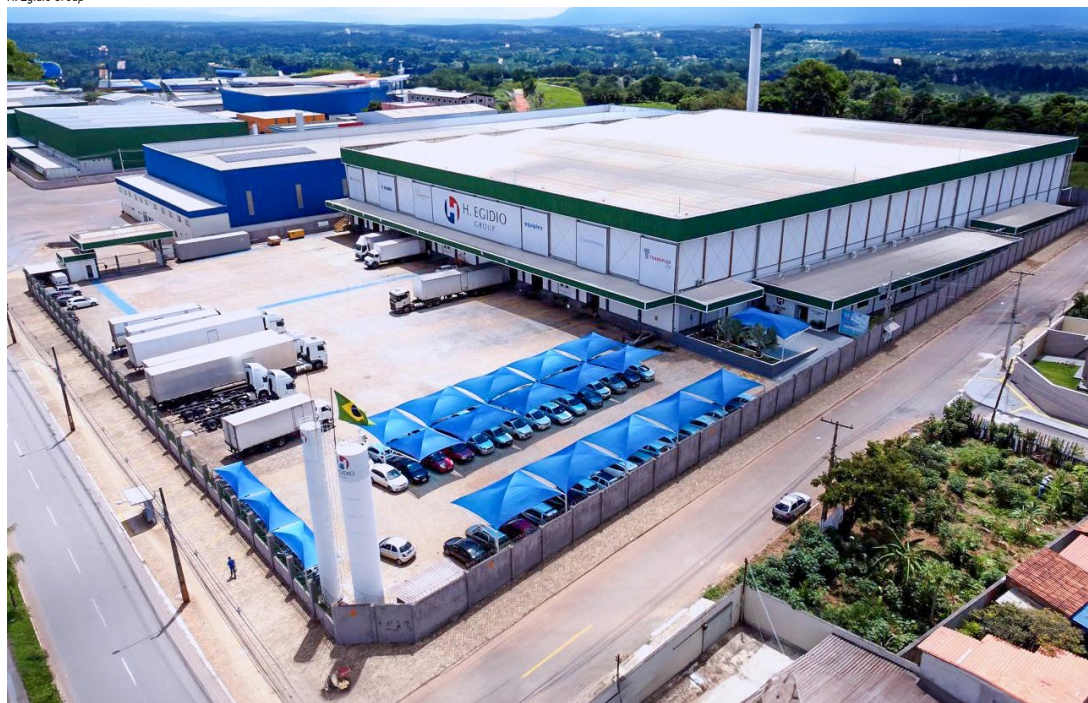
H. Egidio Group

■ H. Egidio Group vai destinar 10% das vagas de emprego ofertadas pelas empresas do grupo a pessoas beneficiadas inscritas no CadÚnico, do governo federal