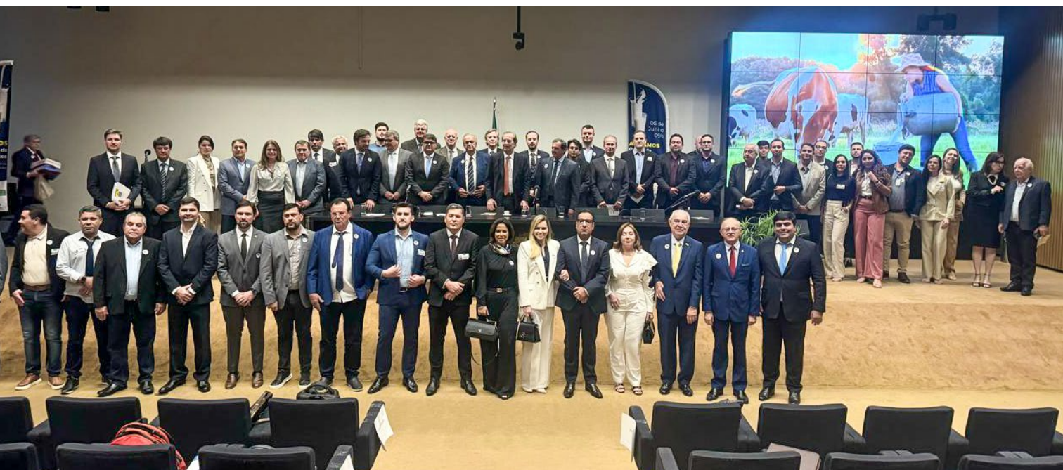
■ Em Brasília, Grito da Cadeia Láctea mobiliza lideranças do setor para discussão sobre fortalecimento da indústria láctea

damental ao crescimento e fortalecimento da indústria láctea. “O assunto mais importante hoje é a Reforma Tributária. Desde 2019, Goiás não avança em produtividade. Pelo contrário, perdeu muito espaço para outros Estados produtores de leite, registrando produção abaixo da média nacional. Por isso, é tão importante nosso engajamento nessa etapa decisiva do debate da Reforma Tributária. Temos potencial para recuperar o protagonismo no ranking nacional e voltar a atrair indústrias e investimentos significativos no setor.”