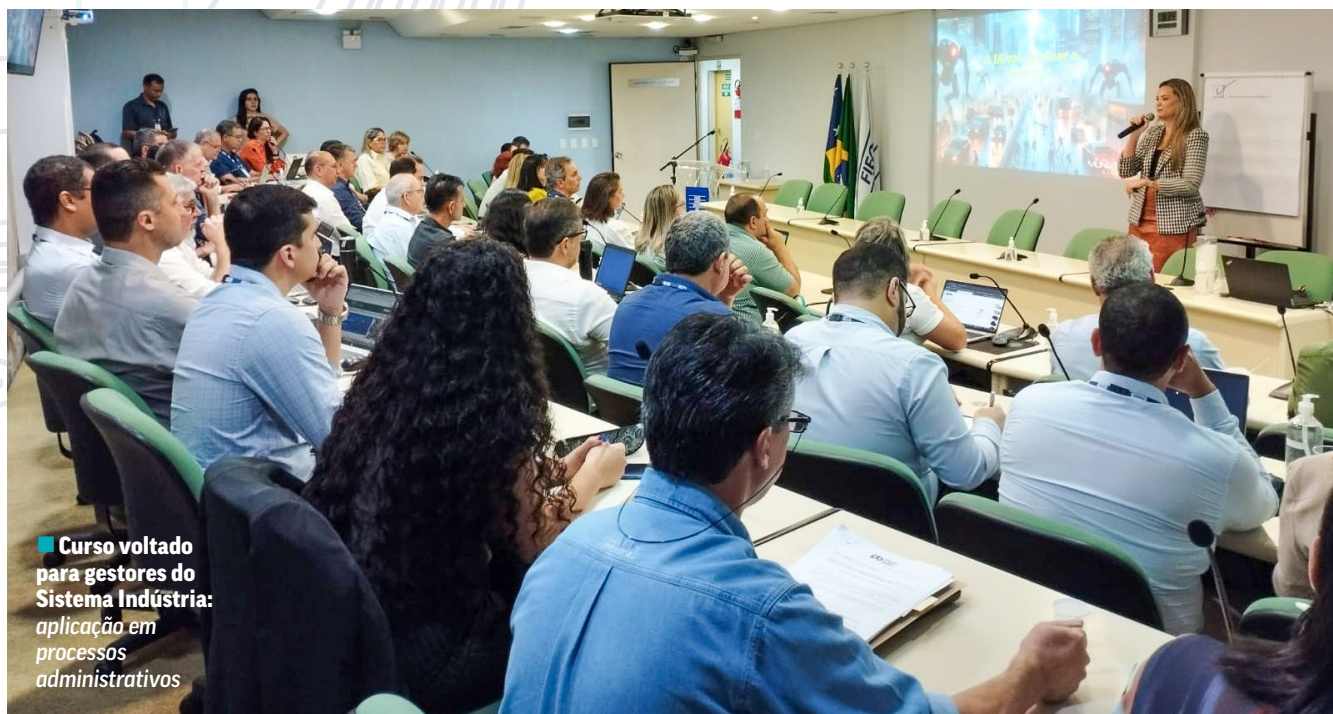
▪ Curso voltado para gestores do Sistema Indústria: aplicação em processos administrativos

Os programas de MBAs da Fatesg estão com centenas de alunos matriculados e demonstram que o Senai está cumprindo sua missão de “promover a educação profissional e o ensino superior” , ao mesmo tempo que contribui com a “competitividade da indústria” .