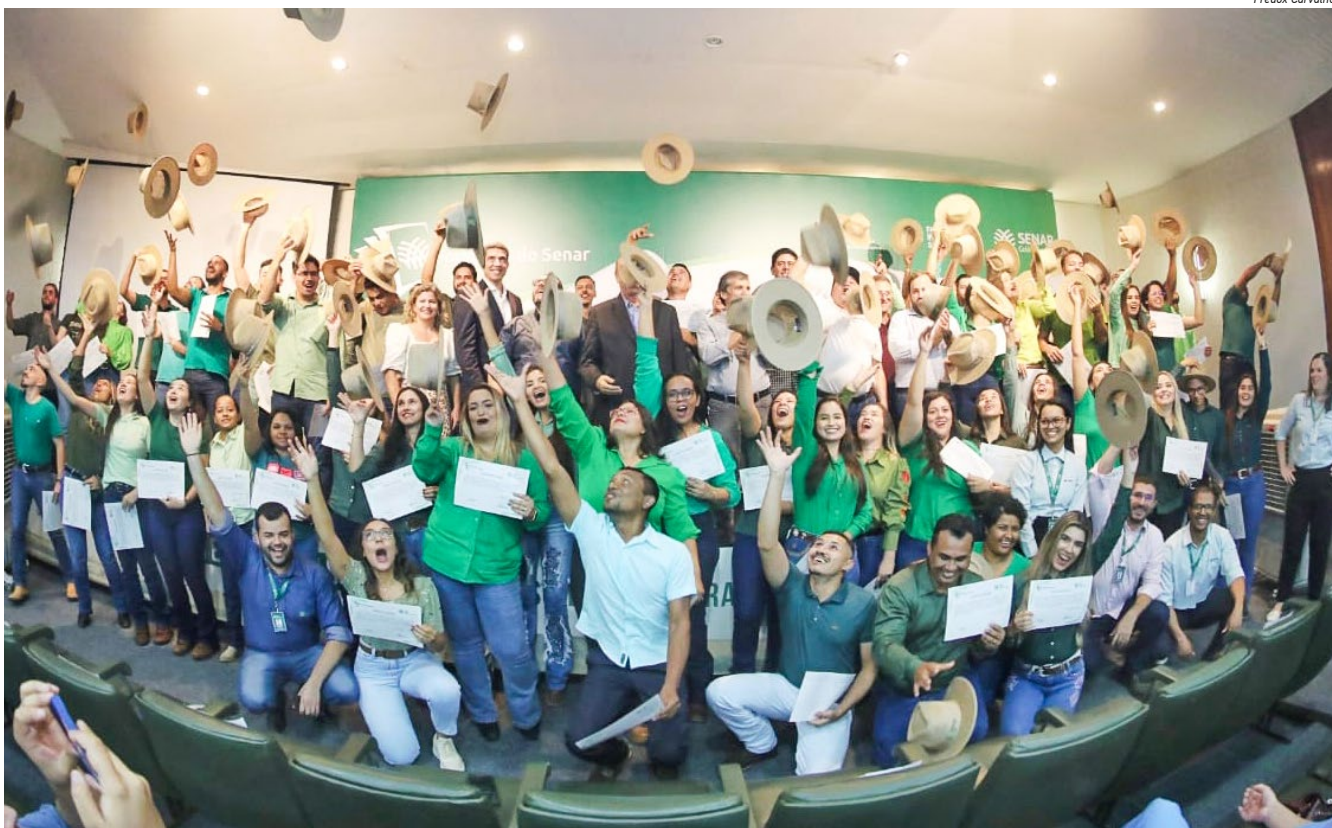
■ Bolsistas celebram encerramento da 1ª fase, com formatura dos participantes