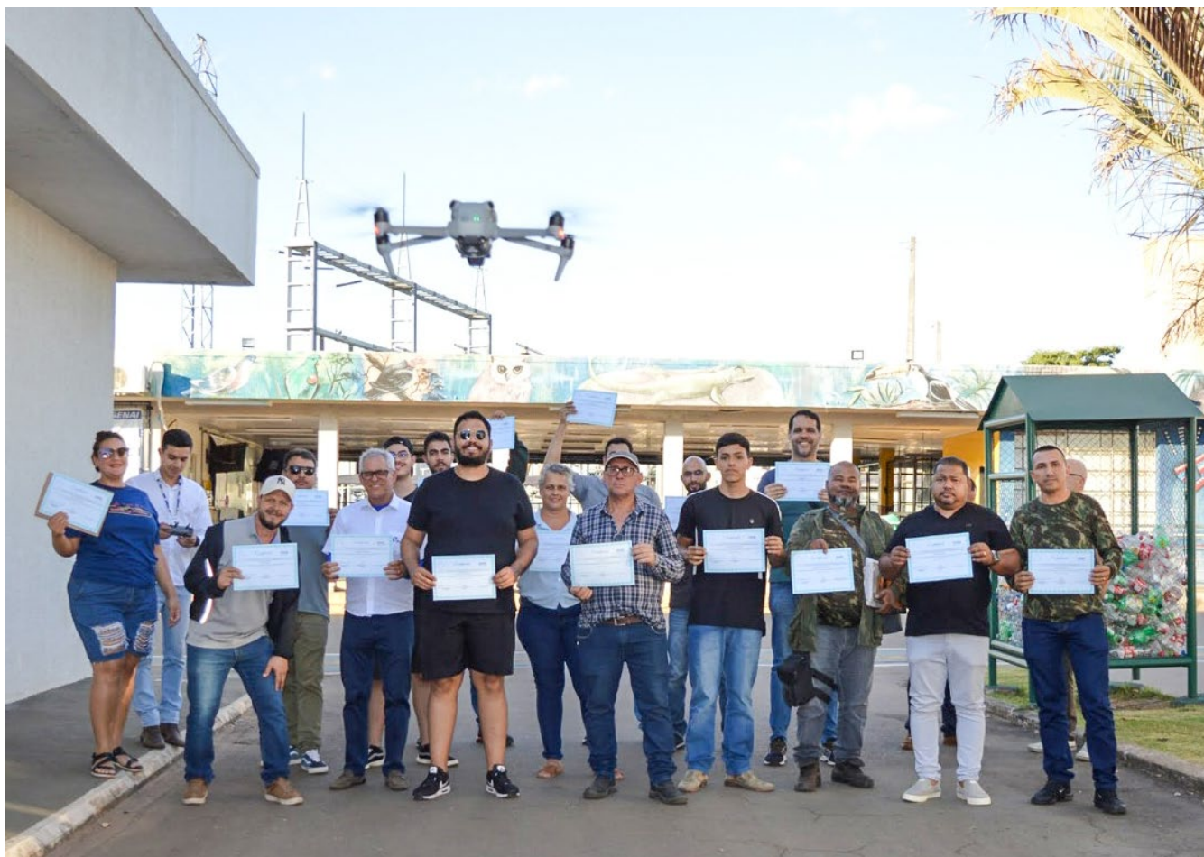
■ Concluintes da turma de operação de drones profissionais exibem certificados do curso do Senai