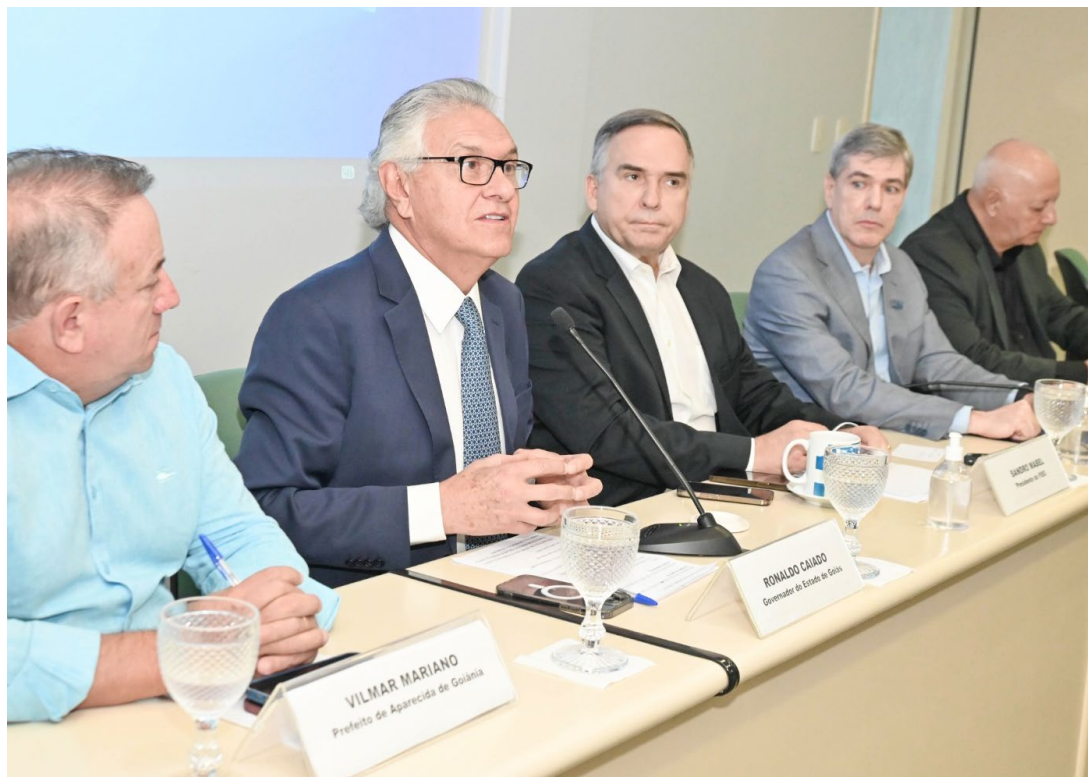
■ Governador Ronaldo Caiado reitera apoio a parcerias do Estado em ações na área de profissionalização

A despedida de Sandro Mabel para disputar a Prefeitura de Goiânia marcou a transferência de gestão para André Luiz Baptista Lins Rocha , engenheiro civil e presidente-executivo dos Sindicatos da Indústria de Fabri-