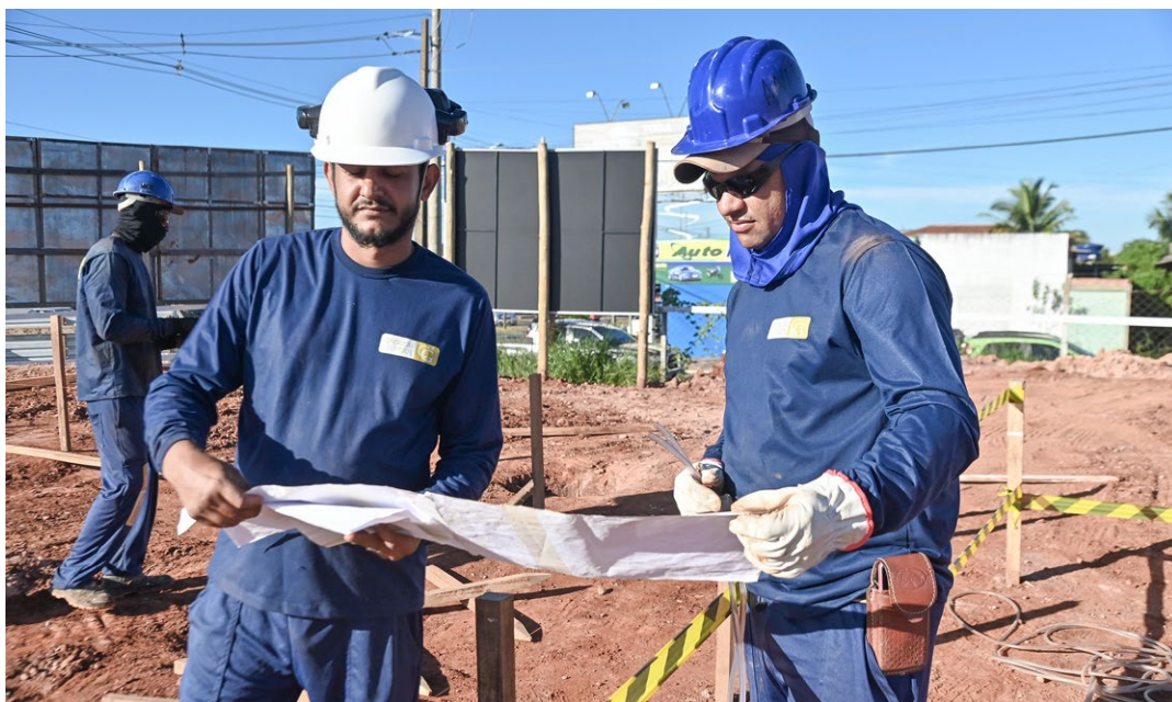
■ EM OBRAS! Operários trabalham no canteiro da Escola Sesi e Senai Mineiros