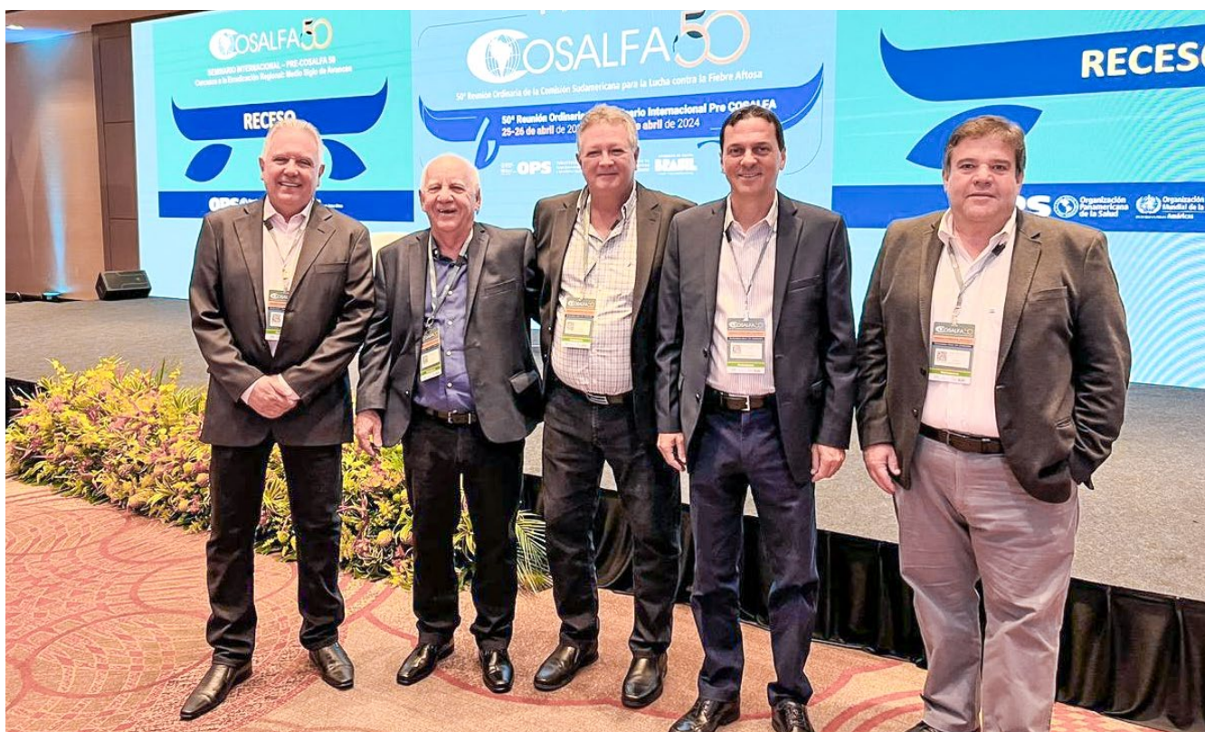
■ Delegação goiana na 50ª Cosalfa, no Rio de Janeiro