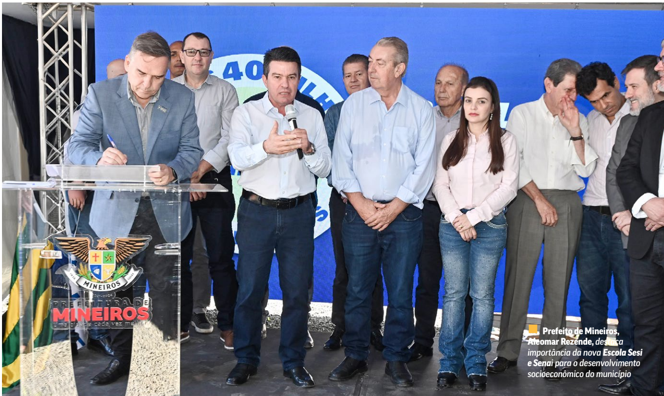
Prefeito de Mineiros, Ateomar Rezende, destaca importância da nova Escola Sesi e Senai para o desenvolvimento socioeconômico do município