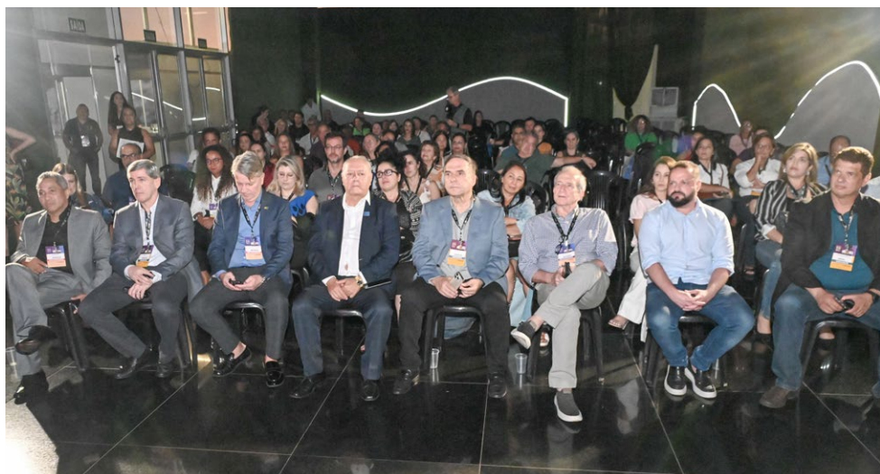
■ Abertura da Comtex reúne empresários, lideranças e autoridades no Centro de Convenções da PUC-GO