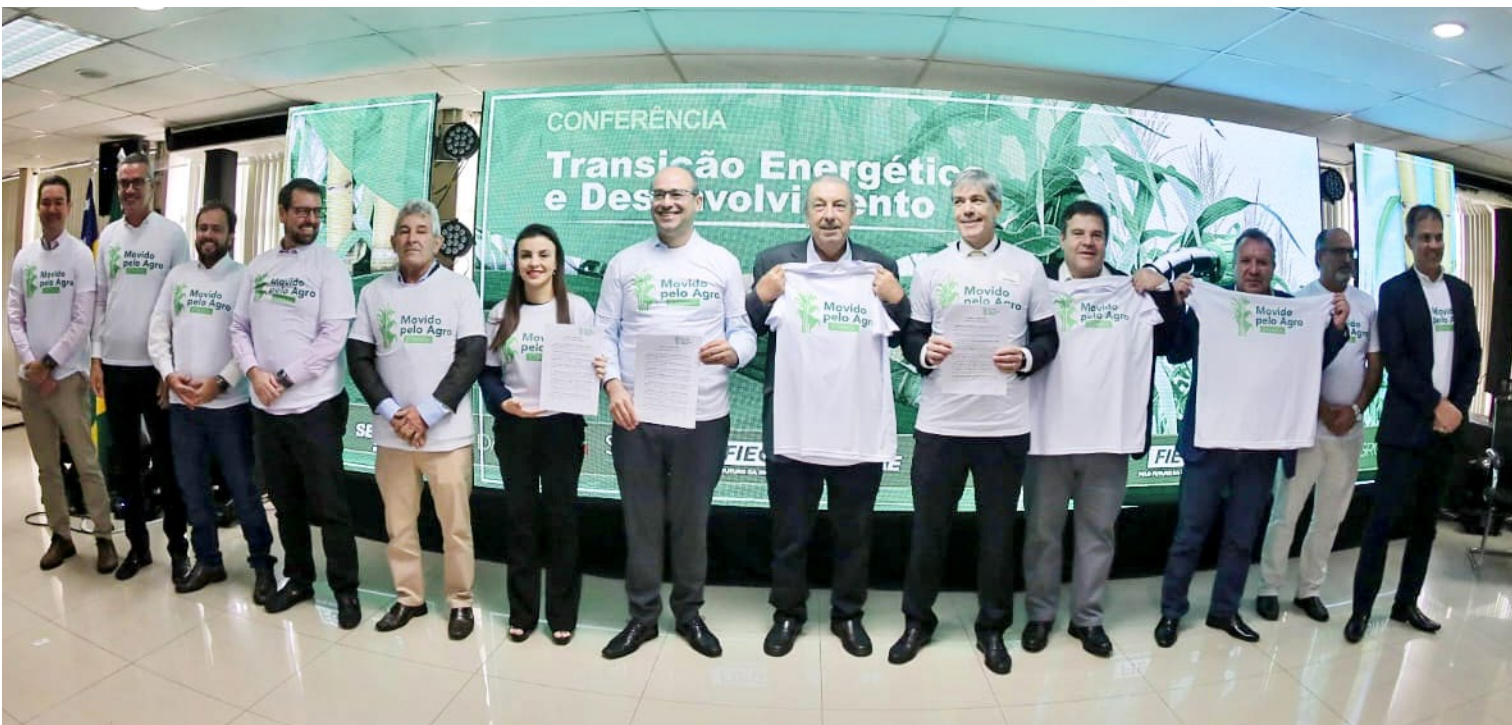
■ VESTINDO A CAMISA! Lideranças do Fórum Empresarial de Goiás comprometem-se a utilizar etanol em suas frotas de veículos leves