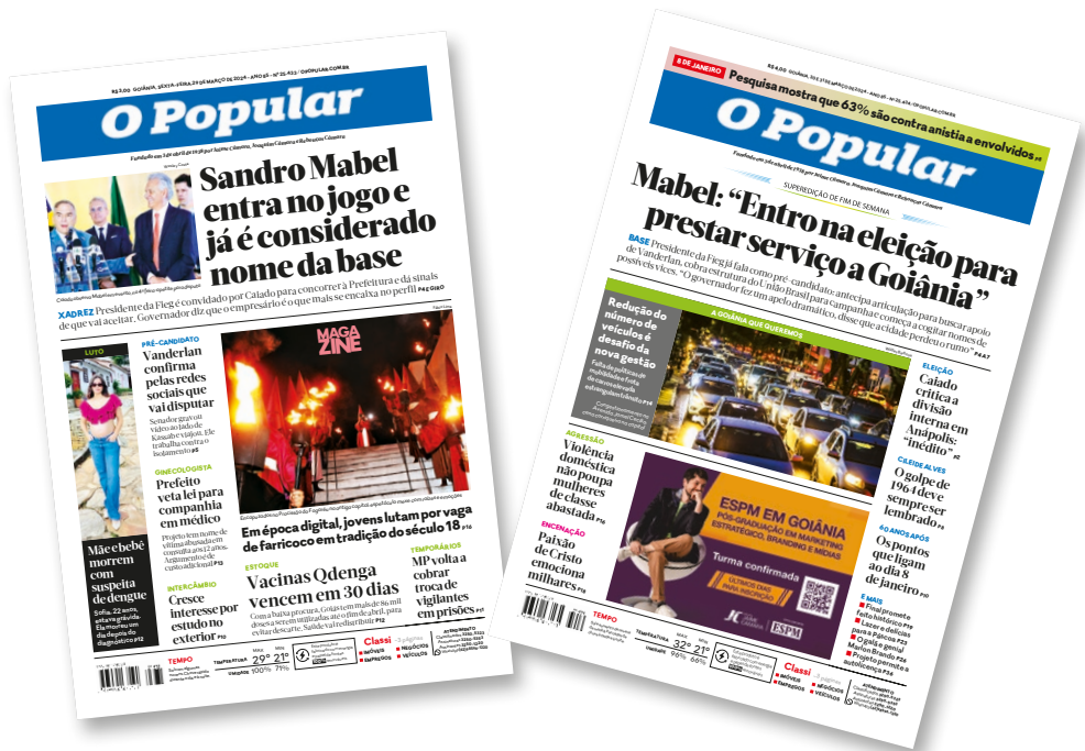
■ Anúncio da candidatura foi divulgado em manchetes de capa de O Popular em duas edições seguidas (29 e 30/03)

desconhecida politicamente. É presidente da Fieg, diretor da CNI. Em segundo lugar, é uma pessoa que tem habili-