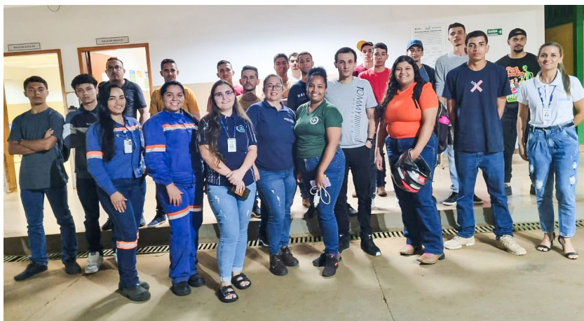
■ Em Barro Alto, turma de habilitação em mineração inicia jornada de 1.200 horas em curso EaD