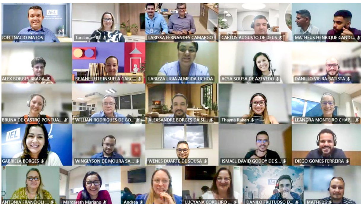
■ ALEGRIA, ALEGRIA! Colaboradores do IEL acompanham anúncio do pagamento do PPR