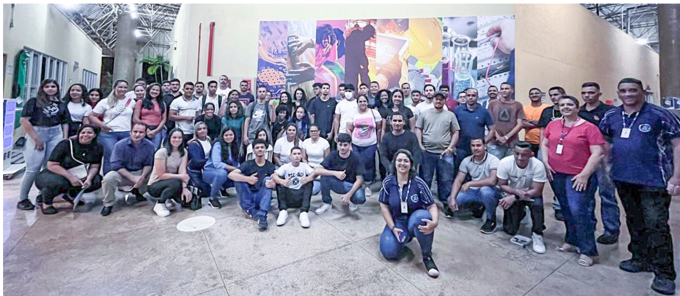
■ Em Niquelândia, alunos dos cursos técnicos em eletrotécnica e segurança do trabalho têm momento de confraternização em aula inaugural

Com todos os cursos técnicos do top 10 em empregabilidade apontados na pesquisa nacional aprovados em seu portfólio, o Senai Goiás potencializa o atendimento a indústrias e à comunidade ao oferecer habilitações técnicas também Na modalidade de ensino a distância (EaD), por meio da plataforma da Unidade Digital Sesi e Senai, em Goiânia